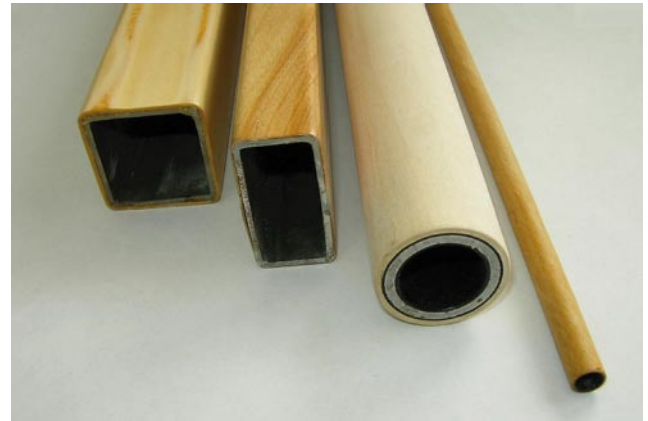
写真2 様々な形状の木材・金属複合パイプ

木材・金属複合パイプとは、金属パイプに単板を巻き付けて接着した、金属パイプの高い強度と木材の暖かみを兼ね備えた材料です（写真2）。