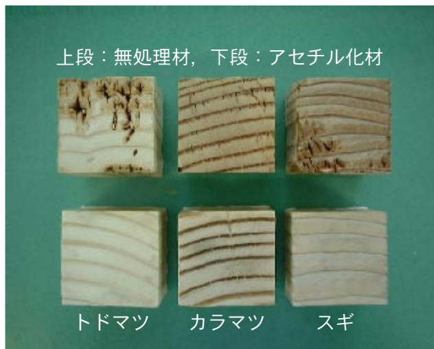
写真1 道産針葉樹材のアセチル化による耐久性向上の一例 (木口断面での腐朽状況の観察)

こうした処理としては、元々耐朽性・耐候性が高い樹種を用いる方法のほか、元々含まれる木材成分自身を耐久性のある性質に化学的に変化させる方法（化学修飾）、木材内に不溶性の無機物を形成する方法（木材の無機化）などがあります。当场では、化学修飾の一種であるアセチル化という手法によるトドマツやカラマツ、スギなど道産針葉樹材の耐久性について検討を行い、耐朽・耐候性とも大きく向上することを確認しています（写真1）。