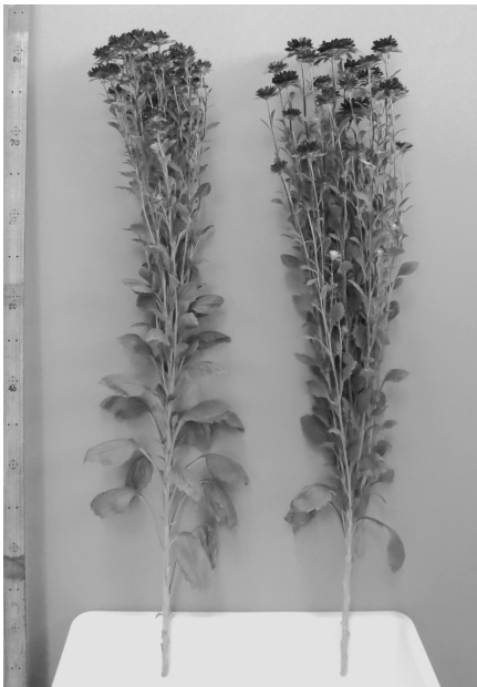
写真1 ボリューム感の変化 左:無処理 右:LED照明 (品種:ステラディーブブルー)