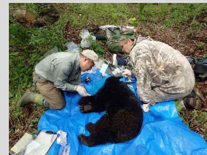
テレメトリー調査