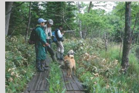
クマ対策研修（知床）