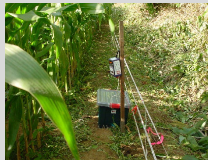
電気柵の設置試験