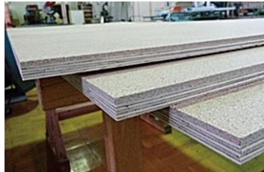
一体化された複合フローリング基材