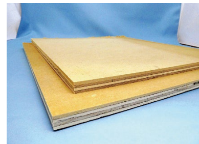
複合フローリング基材

本技術を用いると、木質ボード製造時の熱圧縮と同時に合板を接着・一体化させることが可能となり、コストを削減しながらも反りの少ない複合フローリングを製造することができます。