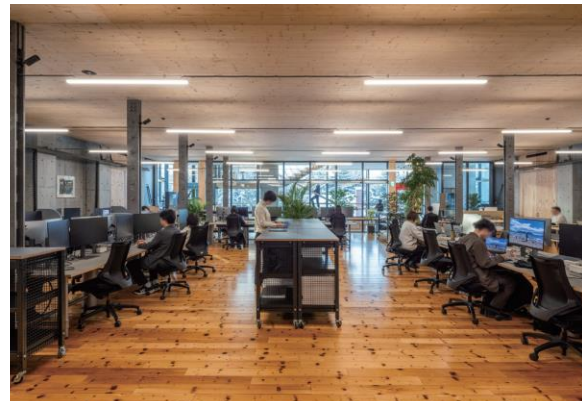
松原産業株式会社「圧密化フローリング」 道産材を利用したナチュラルで暖かみのある空間作りに一役買っています。