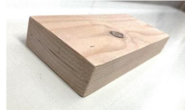
接着試験体(トドマツ)