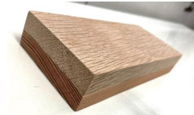
接着試験体(ミズナラとカラマツ)