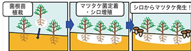
野外林地での試験のイメージ

本栽培方法では、マツタケ菌糸の培養以外の工程は、無菌環境下で行う必要がありません。このため、コンテナなど通常の栽培容器を用いて簡便に菌根苗を作製することができます。